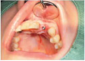
②インプラント埋入時