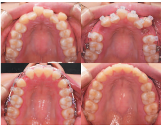
左上：初診 右上：抜歯後ワイヤー装着 左下：前歯の後退 右下：1年5ヵ月後装置撤去

明るい雰囲気の内側で、患者さんの要望にもしっかりと耳を傾け、笑顔が優しいスタッフとともに対応。院長は「矯正治療は年齢を問わず可能です。歯を抜いて治すこともありません。抜かないことにこだわります。何が最適な治療法か、まずはご相談ください。土曜、日曜もやっています」と柔軟な笑顔で話した。