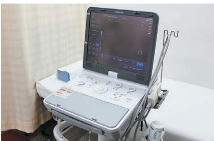
超音波診断装置（エコーグラム）など高度な医療機器が揃う