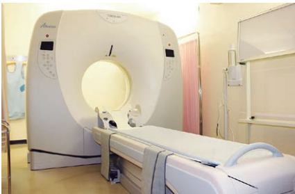
迅速で正確な診断に生かせる高速マルチスライスCT