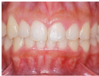
インビザラインによる治療後

矯正装置も大きく進歩した。従来はワイヤーでできた装置が主流だったが、マウスピース型の「インビザライン」が登場し、注目を集めている。透明で目立たず、周囲の人目もあまり気にならない。また、食事などに取り外すことができ、歯磨きも容易だ。美観性だけでなく、機能面や衛生面でもメリットが大きい。希望に応じて処方することができる。