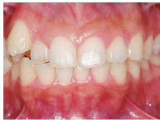
矯正治療を受ける前