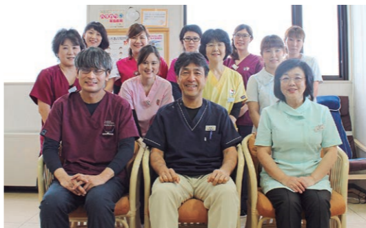
笑顔のすてきなスタッフ一同

17年夏、1996年の開院以来初となる大幅改修工事を実施。LED照明が整備された院内は、より明るく、より衛生的に生まれ変わった。1階トイレは体の不自由な人にもやさしいバリアフリー設計に。2階にもキッズルームが新設された。専用の手術室が設けられ、消毒コーナーを改修。超音波による治療器具の滅菌洗浄機械を導入するなど感染症予防対策を強化した。施設をより機能的に、そして患者さんも、働くスタッフもより快適に」と院長は話している。