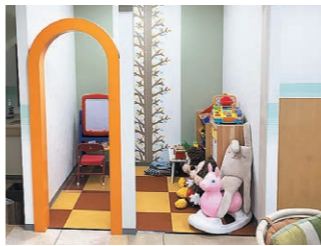
キッズルーム。小さな子がいても安心