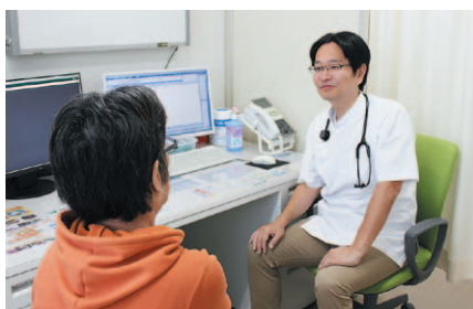
しっかり患者の話しに耳を傾ける