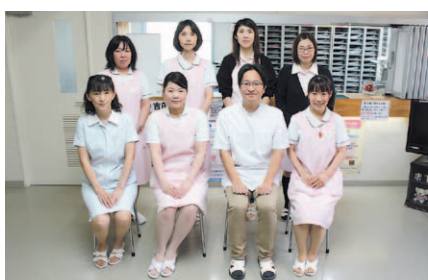
笑顔のスタッフが診療にあたる

認知症が心配な方に、問診による診断や治療、状況に応じて専門医を紹介。閉経後の女性や骨折の既往がある方に、骨粗鬆症の診断と内服や注射による治療も行う。高瀬院長は「がんをはじめとする内科系疾患はできるだけ早期に見出し、次の段階に結び付けることがクリニックの役割。病気発見のためには患者の変化を見逃さないように対話と丁寧な診察を心掛けている」と話した。