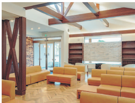
自然をモチーフとした癒やしの待合室