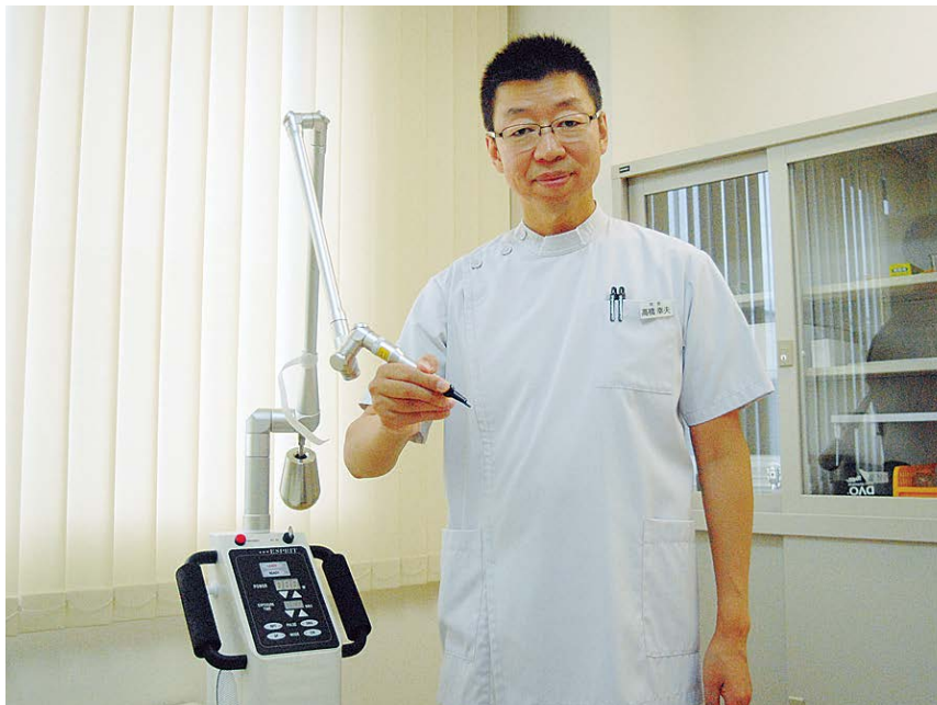
老人性のイボの治療に効果のある炭酸ガスレーザー