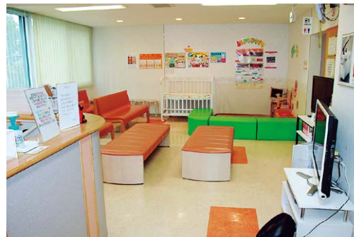
キッズコーナーを設置した待合室と受付