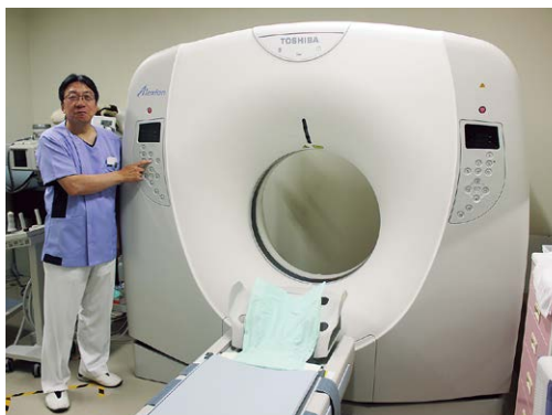
16列CTを更新し、より充実した医療サービスを提供

尿失禁患者に効果的な干渉低周波治療器治療や前立腺がんの早期発見につながる血液検査の「PSA(前立腺特異抗原)検査」、組織を採取する生検も行う。