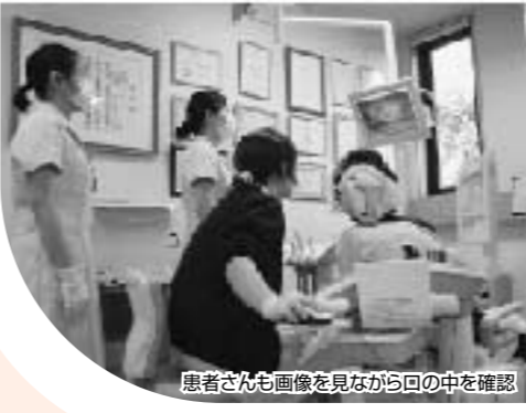
患者さんも画像を見ながら口の中を確認

歯ぐきしり対策にお勧めするのは「スプリント」というマウスピース。これを就寝中に常用すれば、歯や歯肉を守ることが出来ます。スポーツ用の軟らかいタイプとは異なり、硬いプレートでできています。病院で薬を処方するのと同じように、わたしの処方オーダーメイドのスプリントです。当医院の歯科技工士が患者さんに合わせて作ります。わたしも愛用していますが、よく眠れて肩こり解消にもつながります。