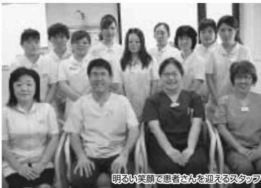
明るい笑顔で患者さんを迎えるスタッフ

当医院では、生涯にわたって自分の歯で生活していただくために、3つの基本理念を掲げています。 ①整った歯並びで、バランスの取れた噛み合わせをつくる ②歯周病を寄せ付けない、口の環境整備 ③就寝時の歯ぐきしりから歯を守る